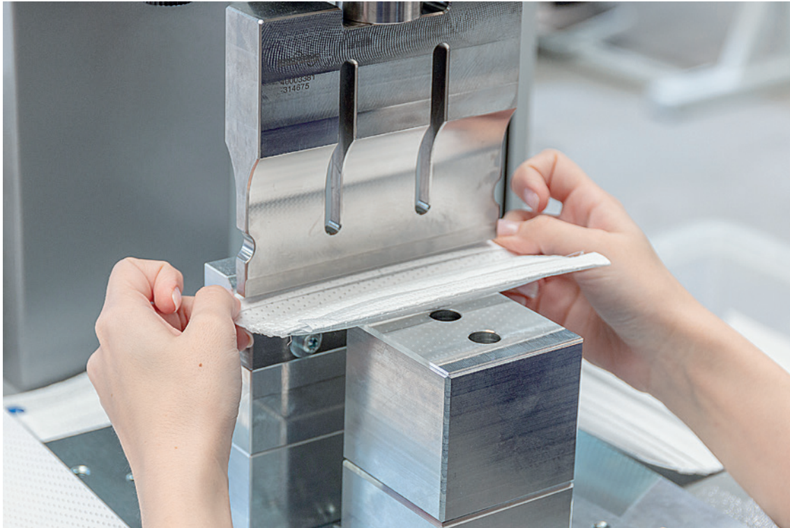
Bildunterschrift: Ultraschall-Schweißen der horizontalen Quernähte des Maskenrohlings für Mund- und Nasenschutzmasken